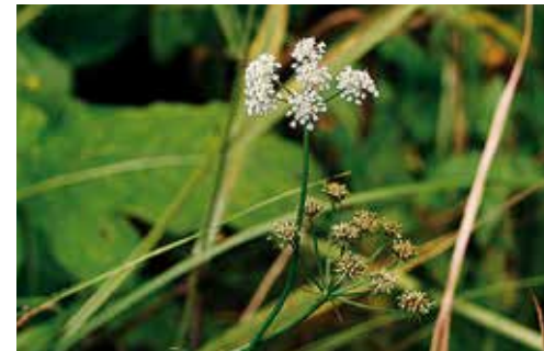
Oenanthe lachenalii