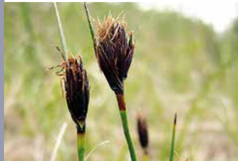
Schoenus nigricans