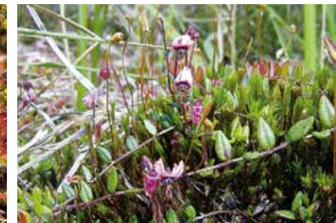
Vaccinium oxycoccos