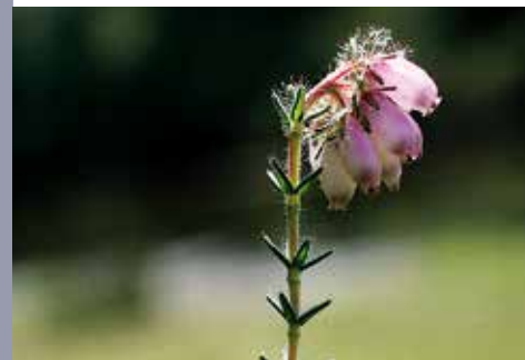
Erica tetralix