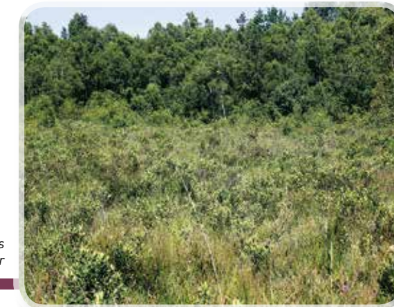
Ericenion tetralicis à Poigny-la-Forêt (78)

Habitat d'intérêt européen prioritaire ou seulement communautaire, si il est dégradé mais susceptible d'être restauré. On conservera absolument toutes les stations régionales subsistantes de cet habitat patrimonial et déterminant ZNIEFF.