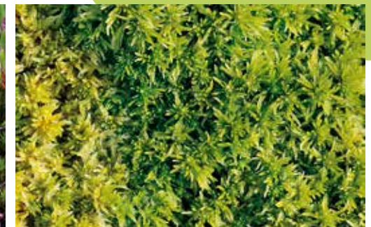
Sphagnum sp.