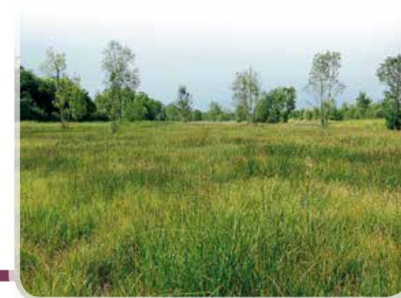
Hydrocotylo vulgaris - Schoenion nigricantis à Episy (77) - © Tfer

Habitat d'intérêt européen communautaire, déterminant ZNIEFF et patrimonial en Île-de-France. On conservera toutes les stations subsistantes de cet habitat en bon état et on tentera de restaurer toutes celles encore susceptibles de l'être.