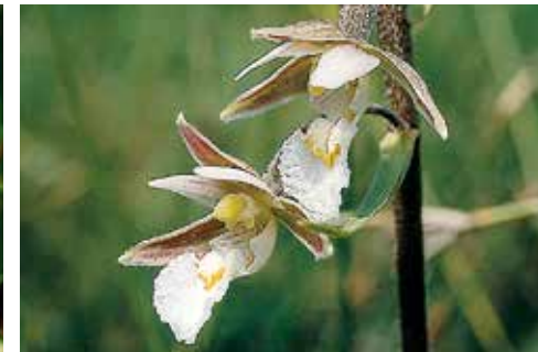
Epipactis palustris