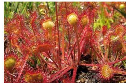
Drosera rotundifolia