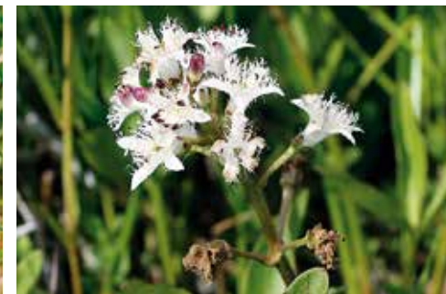
Menyanthes trifoliata