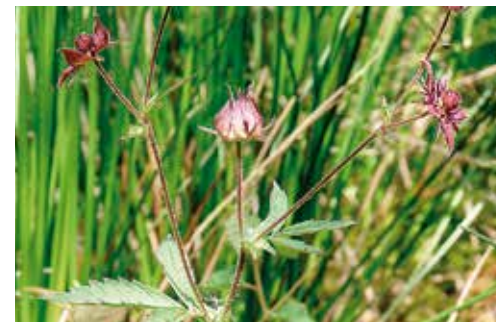
Potentilla palustris