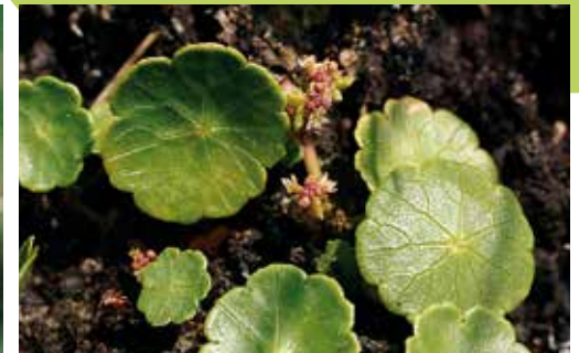
Hydrocotyle vulgaris