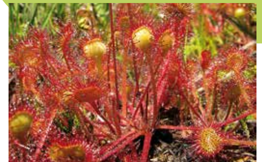
Drosera rotundifolia