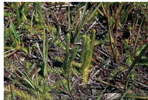
Lycopodiella inundata