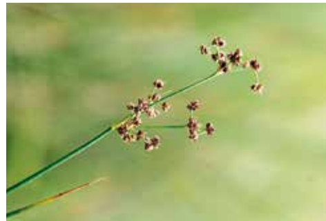
Juncus subnodulosus