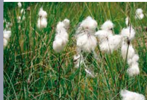
Eriophorum angustifolium