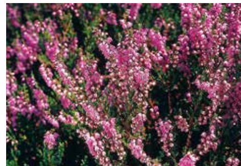
Calluna vulgaris