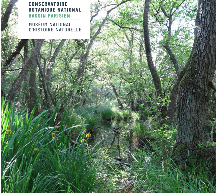
Végétation hygrophile : aulnaie marécageuse à fougère des marais