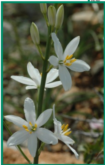
Phalangère à fleurs de Lis Anthericum liliago