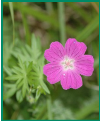
Géranium sanguin Geranium sanguineum